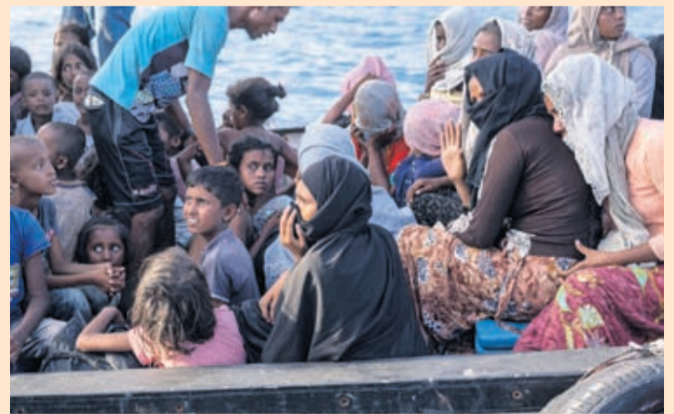
Ethnic Rohingya people sit on the deck of a boat off North Aceh, Indonesia, Wednesday, June 24, 2020.

More than 700,000 Rohingya have fled Myanmar since August 2017, when